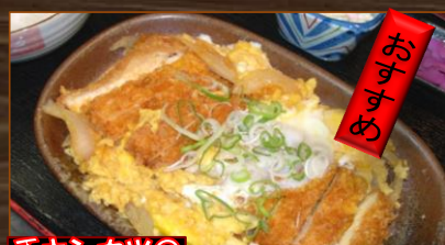
チキンカツの味噌煮卵とし ¥680