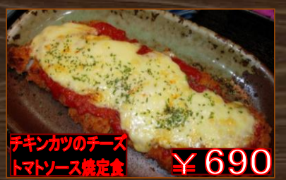
チキンカツのチーズトマトソース焼定食 ¥690