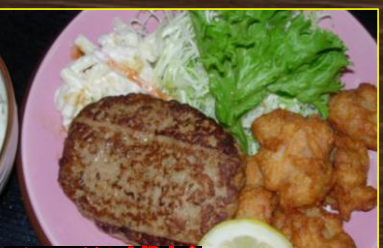
ハンバーグ&唐揚定食 ¥690