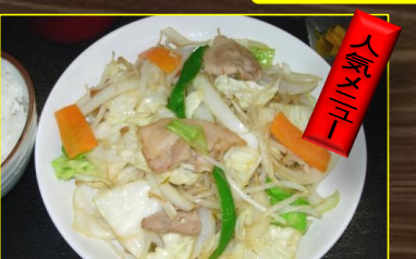
和風野菜炒め定食 ¥580