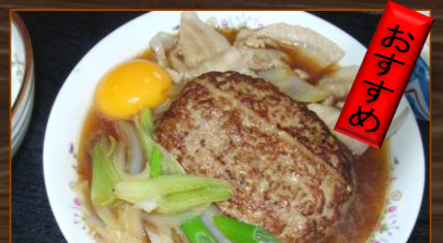
すき焼き風ハンバーグ ¥680