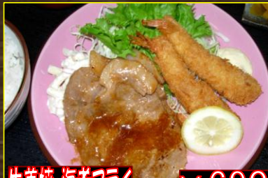
生姜焼・海老フライ ¥690