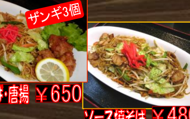
焼きそば・唐揚 ¥650 ソース焼きそば ¥480