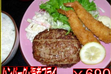
ハンバーグ・海老フライ ¥690

★定食のご飯は、おかわり無料です!★ ★カレー、丼物のご飯大盛りは無料です!★ ※お気軽に従業員までお申し付け下さい