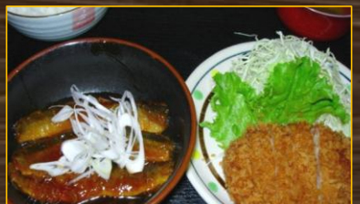
さんまの蒲焼とメンチカツ ¥650