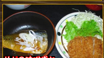
サバの味噌煮とメンチカツ ¥650